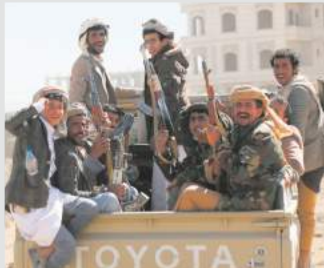
GUERRIGLIERI I combattenti Houthi nello Yemen

di Giovanni Castellaneta alle pagine 4-5