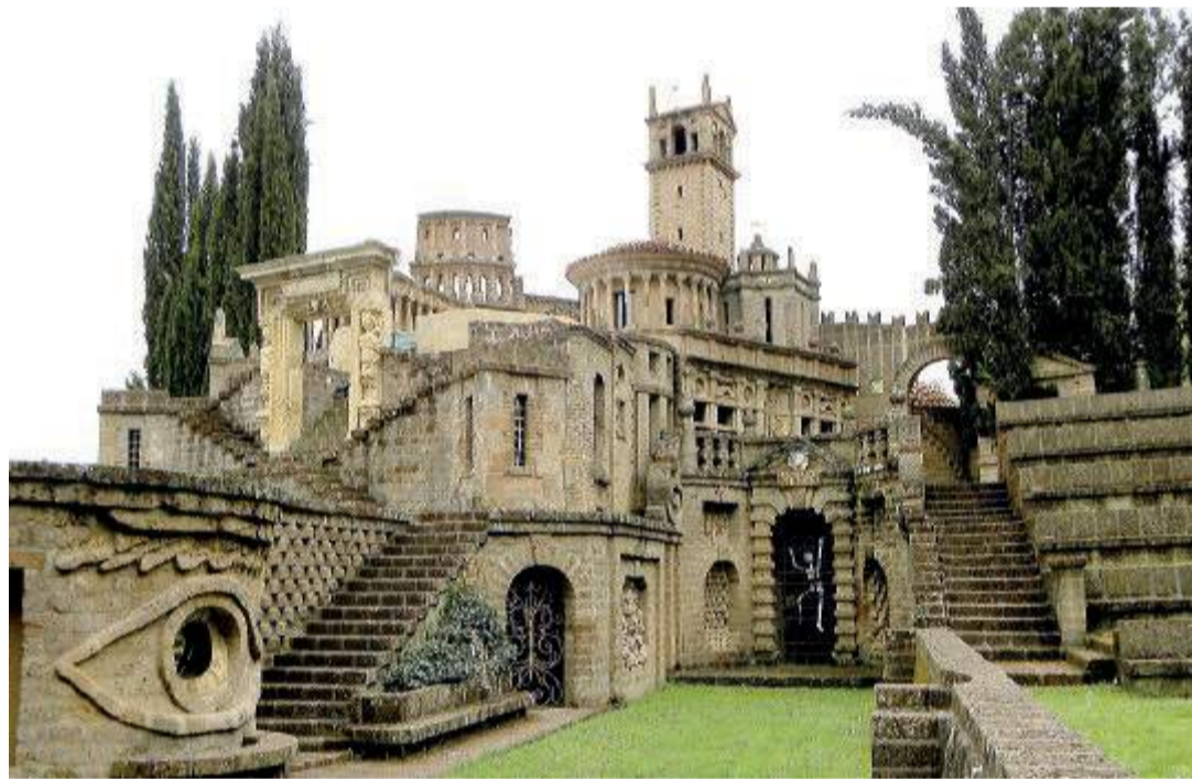
La Scarzuola La città ideale dell'architetto Tomaso Buzzì entra nel network dei Grandi Giardini Italiani