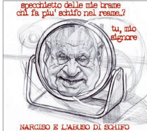
NARCISO E L'ABUSO DI SCHIFO