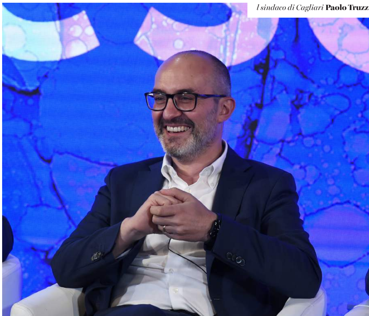
L sindaco di Cagliari Paolo Truzzu

Sulle regionali il centrodestra risolve il nodo della Sardegna con il passo indietro della Lega, ma si attorciglia sulla Basilicata. Sullo sfondo aleggia il dubbio su un pressing strumentale del Carroccio, che in realtà potrebbe essere intenzionato a fare ostruzionismo contro il governatore lucano uscente Vito Bardi per poi mollare all'ultimo miglio, solo in cambio del via libera degli alleati di coalizione alla proposta leghista sul terzo mandato per i governatori. Un modo per blindare Luca Zaia in Regione Veneto e allontanarlo dalle tentazioni di una sfida a Matteo Salvini per la leadership di Via Bellerio. Intanto continua lo stallo alla messicana. La giornata la augura il vicesegretario della Lega Andrea Crippa, che è il pitbull di Salvini durante tutta questa fase di tensione con Forza Italia e Fratelli d'Italia sui candidati nelle regioni al voto quest'anno. Crippa si fa intervistare da La Repubblica e avverte: "Con i giochi di forza non si va lontano. Mentre col senso di responsabilità e l'attenzione alle competenze e capacità possiamo continuare a vincere". I "giochi di forza", va da sé, sarebbero quelli dei meloniani di FdI, che in Sardegna hanno preteso il ritiro dell'uscente Christian Solinas, sostenuto dalla Lega, per fare posto al sindaco di Cagliari Paolo Truzzu. Crippa dunque insiste sulla Basilicata: