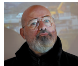
Il governatore Stefano Bonaccini