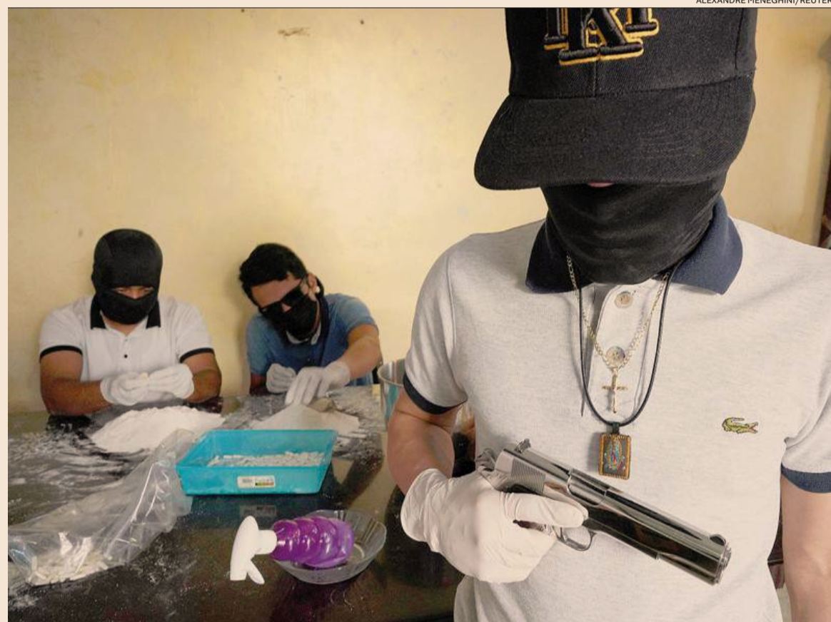
La posta in gioco. Il traffico mondiale di cocaina vale da solo tra i 94 e i 143 miliardi di dollari l'anno