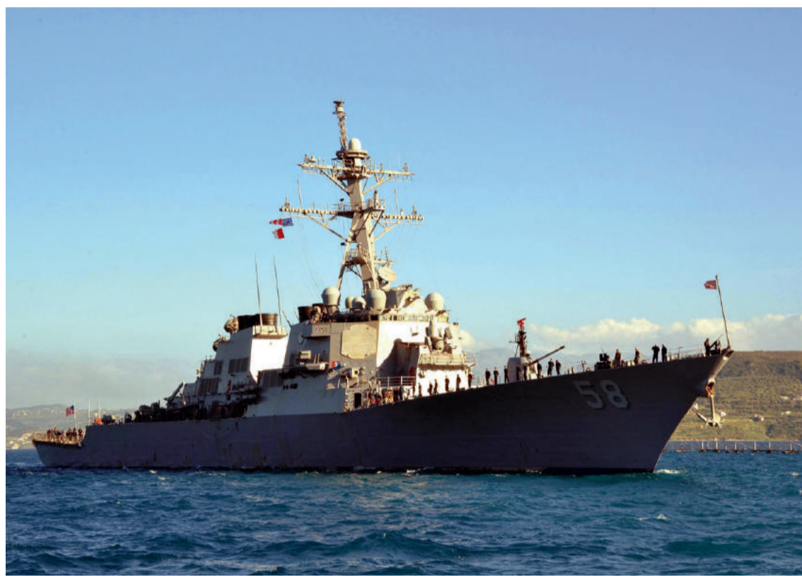
Una nave militare americana